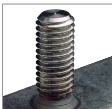
Anwendungsbeispiel Metallbau Example of use Metal construction