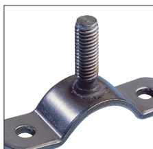
Anwendungsbeispiel Rohrleitungsbau Example of use Pipeline construction